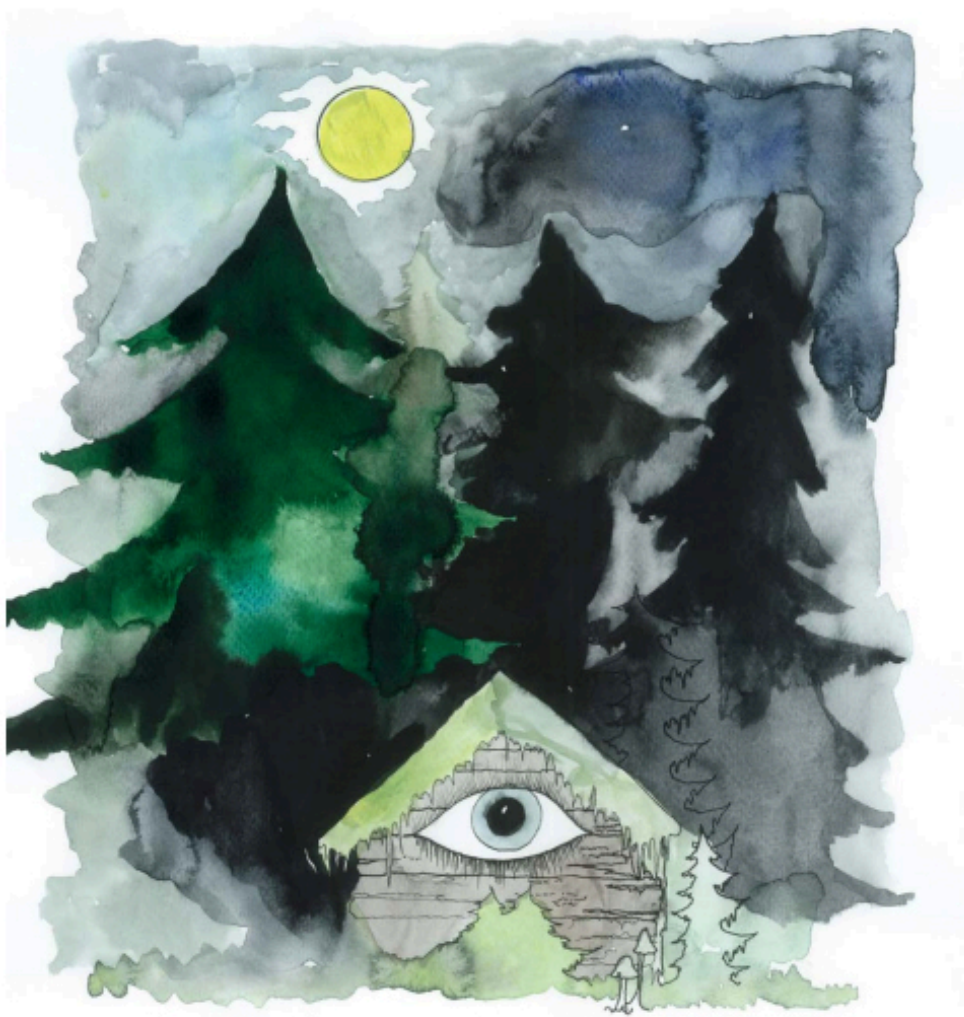
художник: Павел Пепперштейн